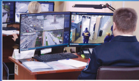
О ВАЖНОМ Система «Безопасный город» в Кагальницком районе