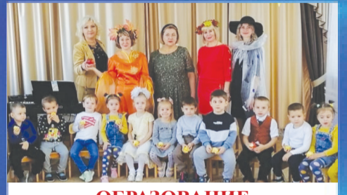
ОБРАЗОВАНИЕ Золотая осень в детском саду «Березка»