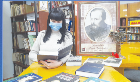
ОБРАЗОВАНИЕ Достоевского читает весь мир