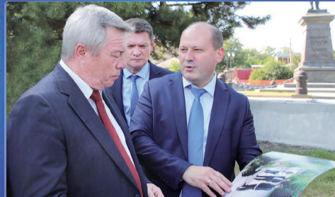
НОВОСТИ ОБЛАСТИ Знать прошлое на пути к будущему