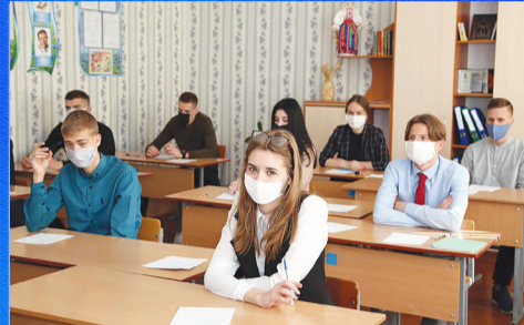
Новости области По единому расписанию