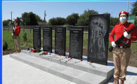
О важном Память, увековеченная в камне