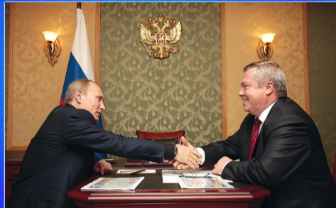
Новости области Рабочие вопросы