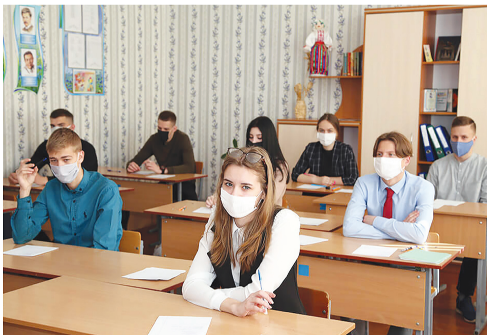
При проведении ЕГЭ будут соблюдены все необходимые меры безопасности

ля состоятся ЕГЭ по географии, литературе и информатике. 6 и 7 июля пройдет самый массовый ЕГЭ – по русскому языку, 10 июля – по профильной математике, 13 июля – по истории и физике, 16 июля – по обществознанию и химии, 20 июля – по биологии и письменной части ЕГЭ по иностранным языкам, 22 и 23 июля – устная часть ЕГЭ по иностранным языкам. Резервные дни запланированы на 24 июля – по всем учебным предметам, кроме русского языка и иностранных языков, и 25 июля – по всем учебным предметам.