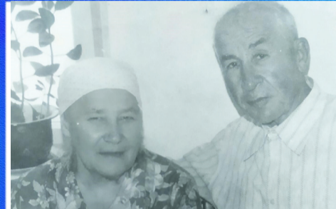
Социум Врач - не профессия, врач - свыше данное...