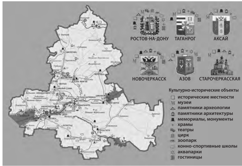
● Туристско-рекреационная карта Ростовской области