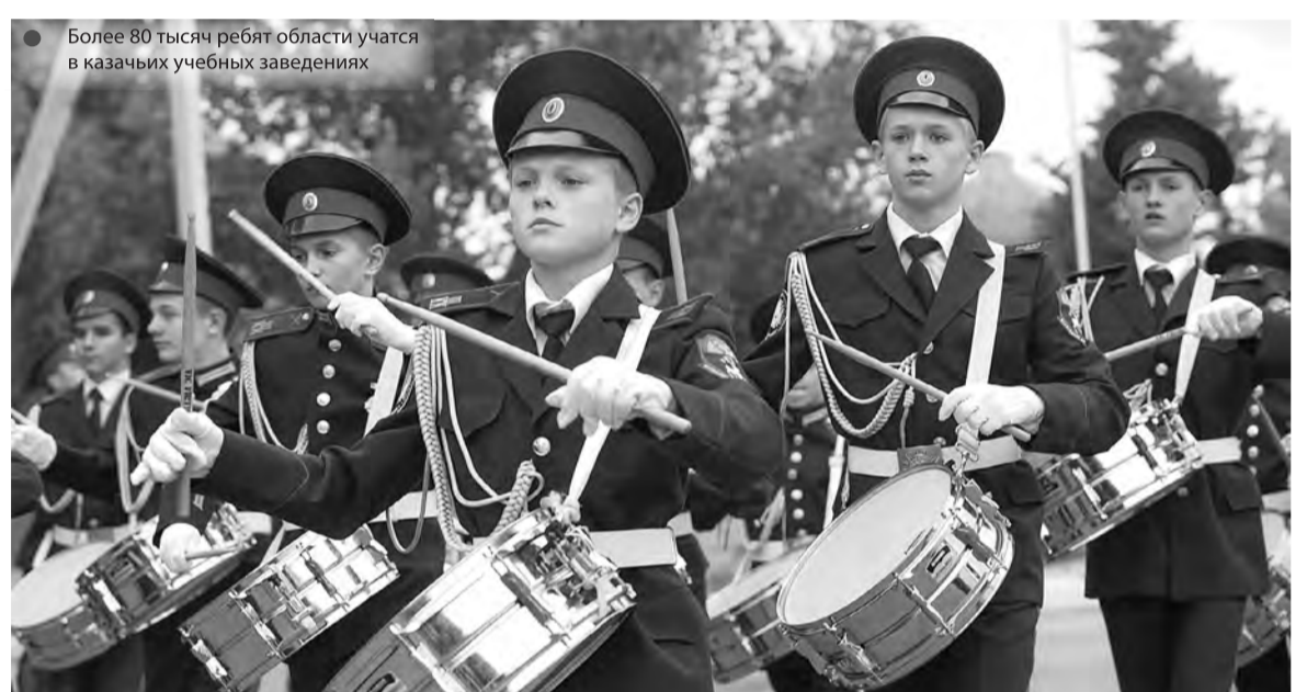
Более 80 тысяч ребят области учатся в казачьих учебных заведениях

По данному вопросу мы активно сотрудничаем с Московским государственным университетом технологий и управления имени Разумовского, Первым казачьим университетом, Южно-Российским государственным политехническим университетом имени М.И. Платова и Донским государственным техническим университетом, вуза-