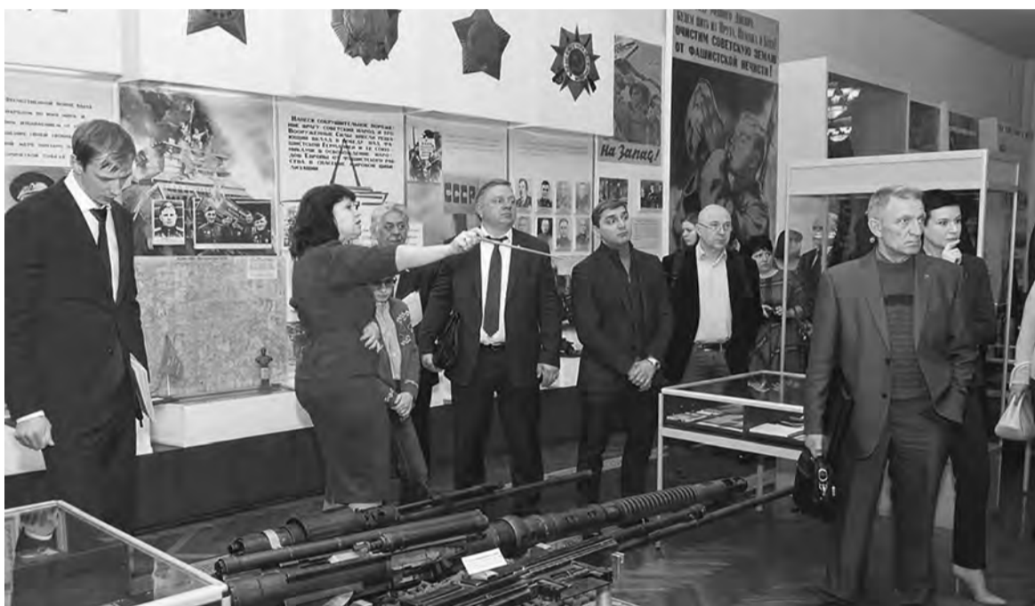
● Расширенное заседание комитета ЗС по законодательству началось с экскурсии в окружной военно-исторический музей

Как было заявлено на заседании комитета, данным до-