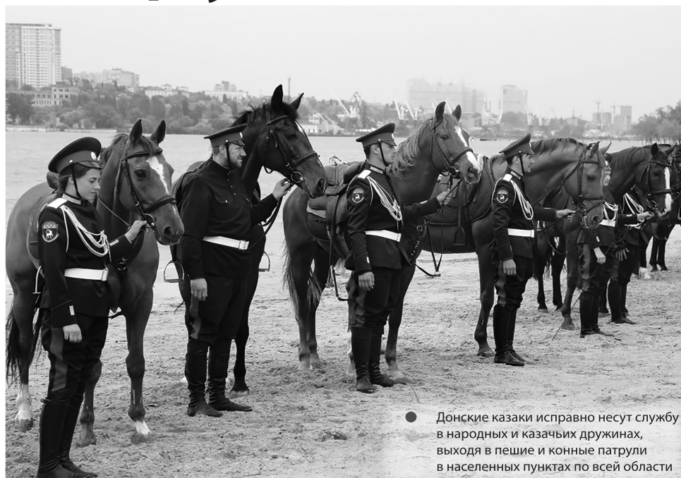
● Донские казаки исправно несут службу в народных и казачьих дружинах, выходя в пешие и конные патрули в населенных пунктах по всей области

Совместно с правоохранительными органами в этом году было выявлено около 19 тысяч административных правонарушений и более тысячи преступлений.