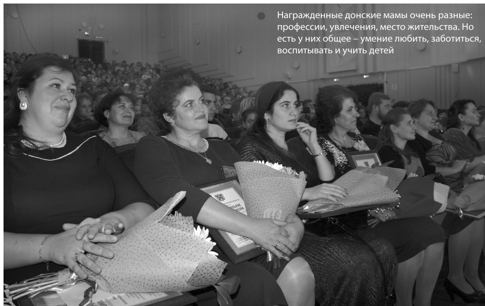
Награжденные донские мамы очень разные: профессии, увлечения, место жительства. Но есть у них общее – умение любить, заботиться, воспитывать и учить детей

Даже заместитель губернатора прислушивается к маминим наставлениям, признаваясь, что с возрастом все боль-