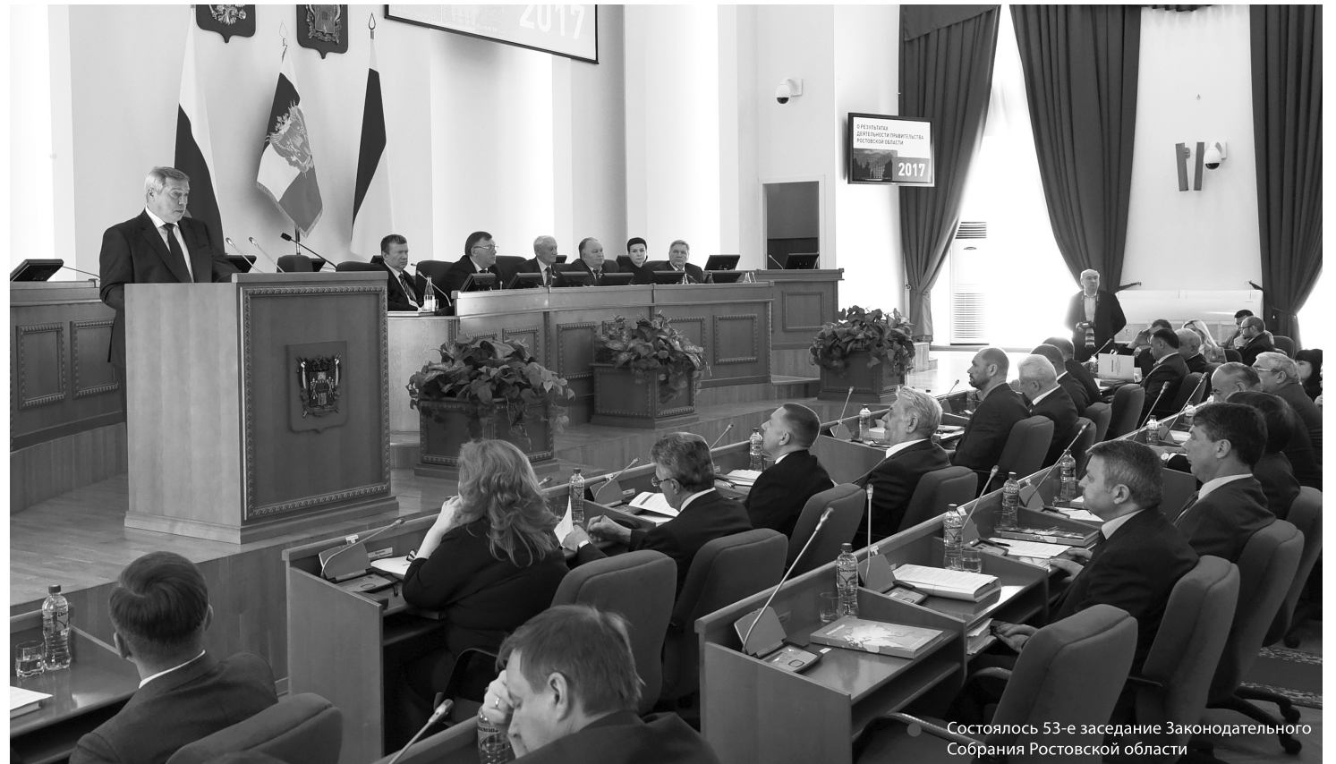
Состоялось 53-е заседание Законодательного Собрания Ростовской области

кон, устанавливающий серьезные ограничения в сфере розничной продажи вейпов (электронных систем доставки никотина) на территории региона. С 1 июня их продажа несовершеннолетним вообще запрещена. А если речь идет об объектах спорта, образования и здравоохранения, то запрет вводится полный, неависимо от возраста.