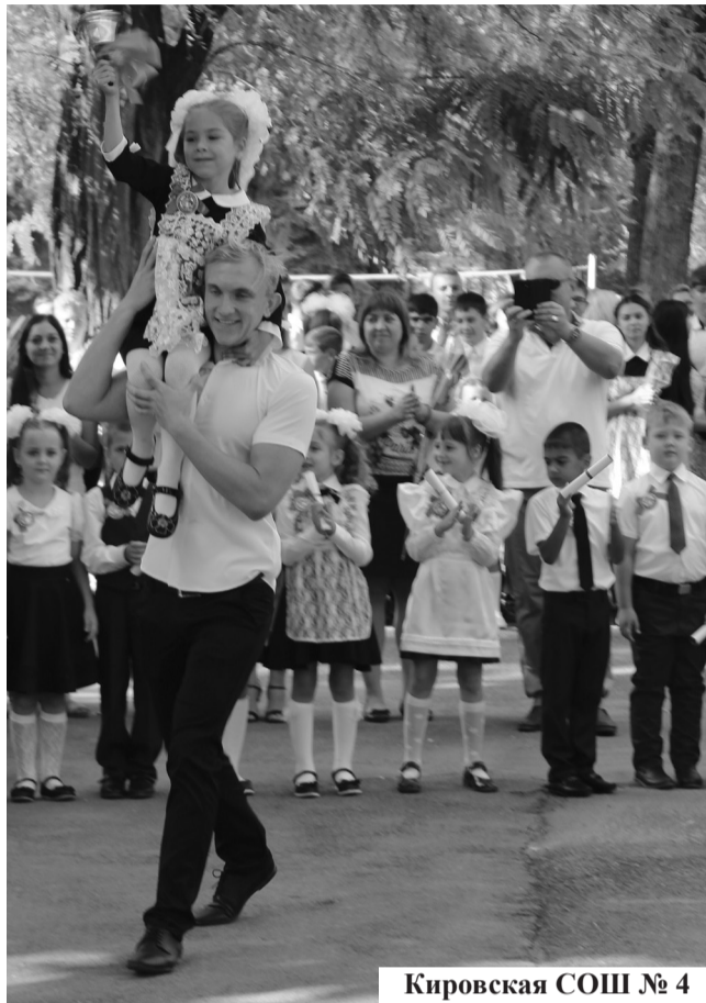
Кировская СОШ № 4

Выше районного среднего балла ЕГЭ по русскому языку у школ № 2, 3, 4, 6, 8, 9 (в 2017 году это были школы № 3, 4, 8). По математике лучших результатов добились школы № 3, 7, 9 (в 2017 году - школы № 1, 3, 4). Таким образом, по двум обязательным предметам лучшие результаты (выше районного показателя) у Вильямской СОШ № 3,