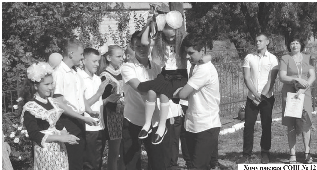
Хомутовская СОШ № 12