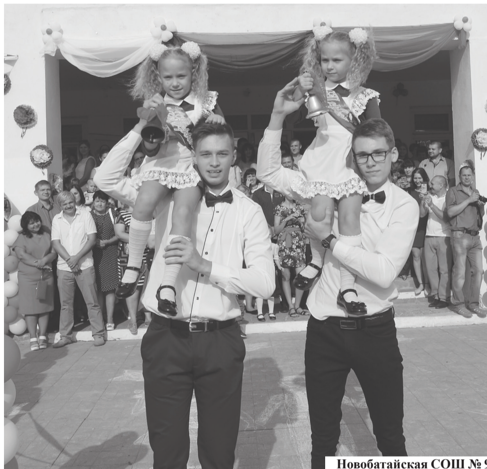
Новобатайская СОШ № 9