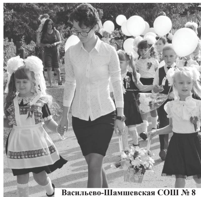
Васильево-Шамшевская СОШ № 8