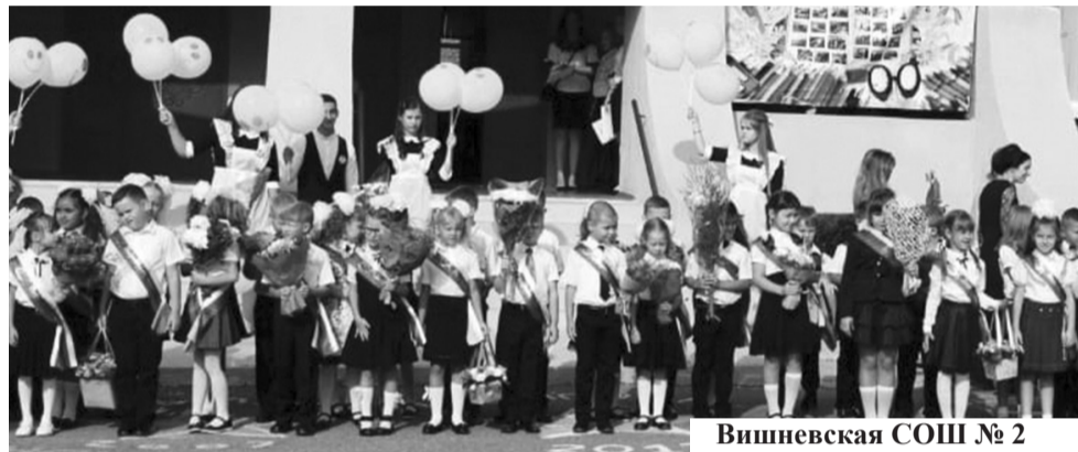
Вишневская СОШ № 2