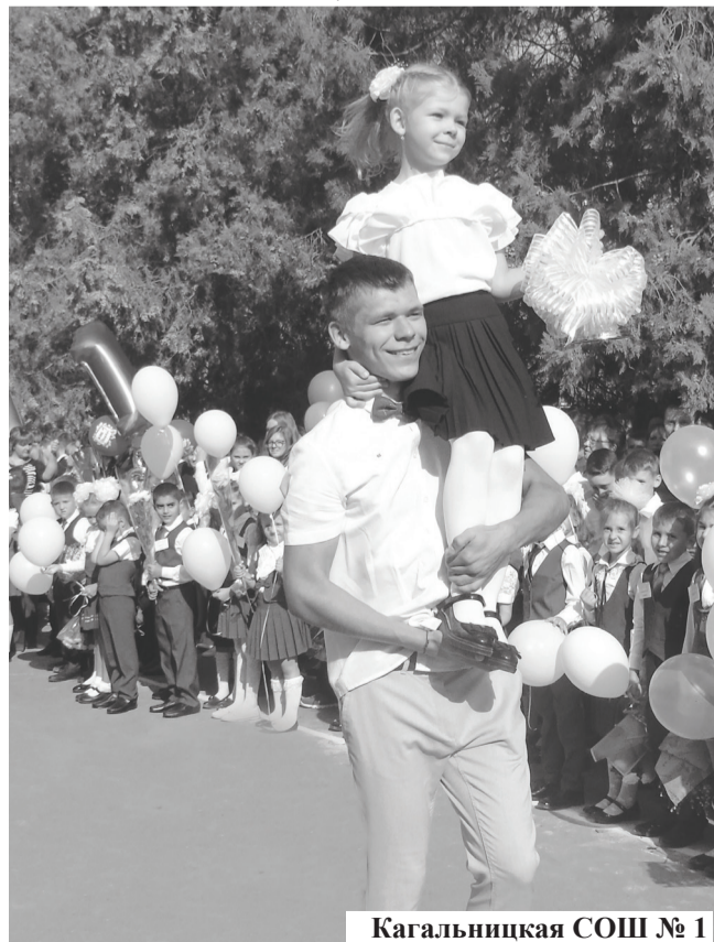
Кагальницкая СОШ № 1