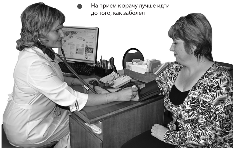
● На прием к врачу лучше идти до того, как заболел

Областной проект «Тихий Дон – здоровье в каждый дом!», работающий уже несколько лет, стал обладателем многих премий – это один из лучших в стране социальных проектов по профилактике различных заболеваний. Врачи проводят обучающие лекции, внеплановые осмотры, рассказывают людям о различных заболеваниях и их предупреждении – что главное. В проекте участвуют практически все лечебные учреждения Ростовской области. Помимо этого на Дону действуют и другие профилактические проекты: