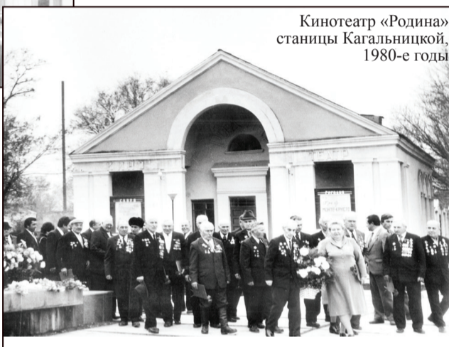
Кинотеатр «Родина» станции Кагальницкой, 1980-е годы