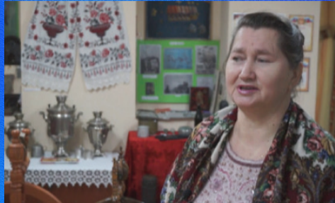
Традиции Станица в казачьем задонье