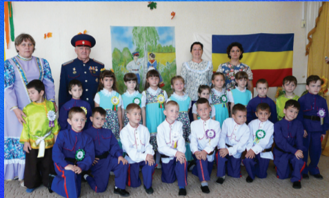
Традиции Во славу казачества песни поем!