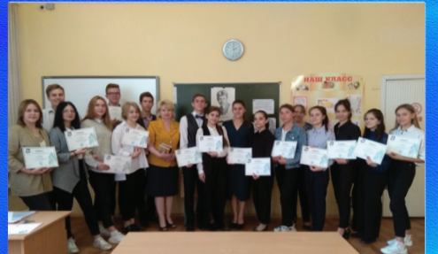
Социум Молодежь читает Есенина