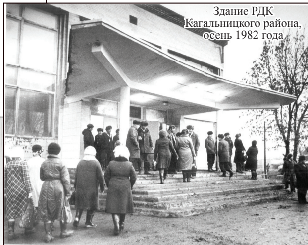
Здание РДК Кагальницкого района, осень 1982 года