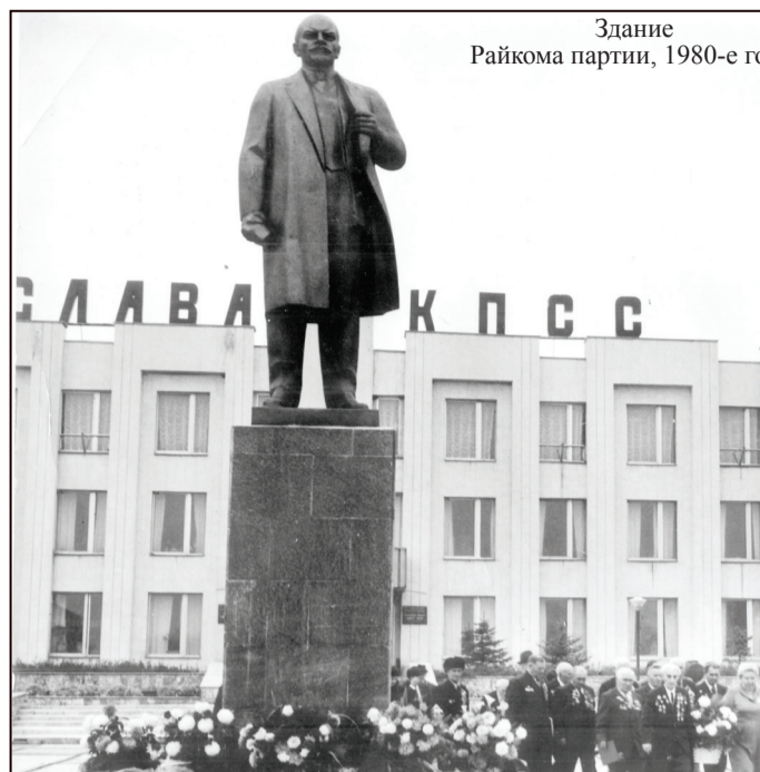
Здание Райкома партии, 1980-е годы