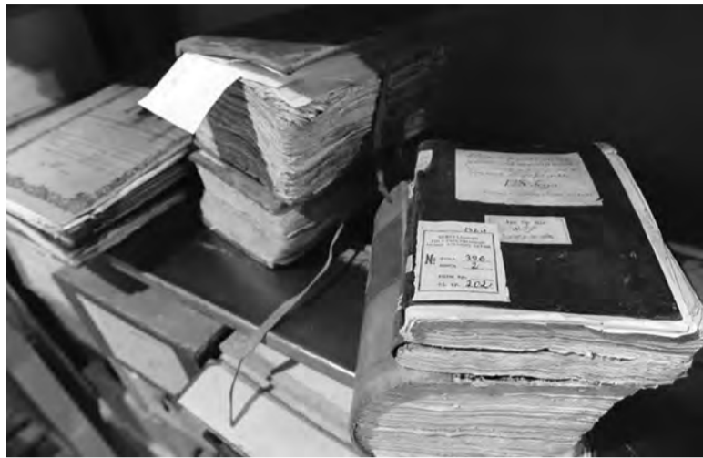
● Необходимые документы с 1 января 2018 года можно будет запрашивать в муниципальных архивах