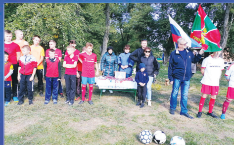
ПАМЯТЬ В память об Учителе