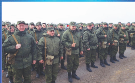
О ВАЖНОМ Запасной призыв - 2021