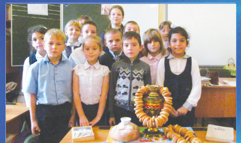
СОЦИУМ Чудо земли – хлеб