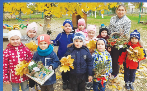
СОЦИУМ День урожая