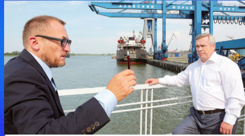
Новости области: выращивать и наращивать