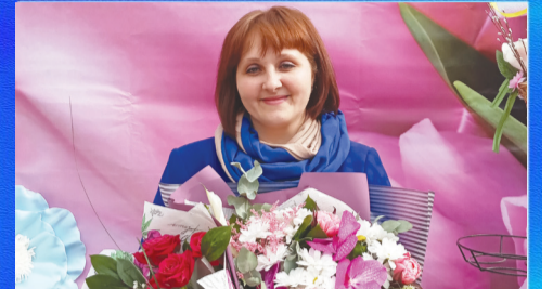
Образование: учитель года Дона