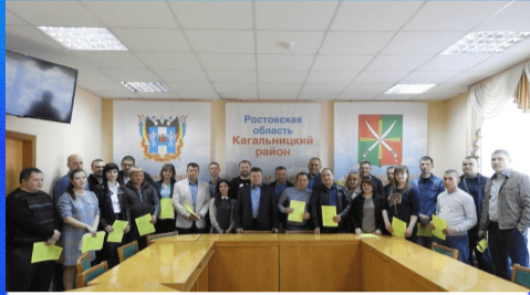
О важном: молодым семьям вручили жилищные сертификаты