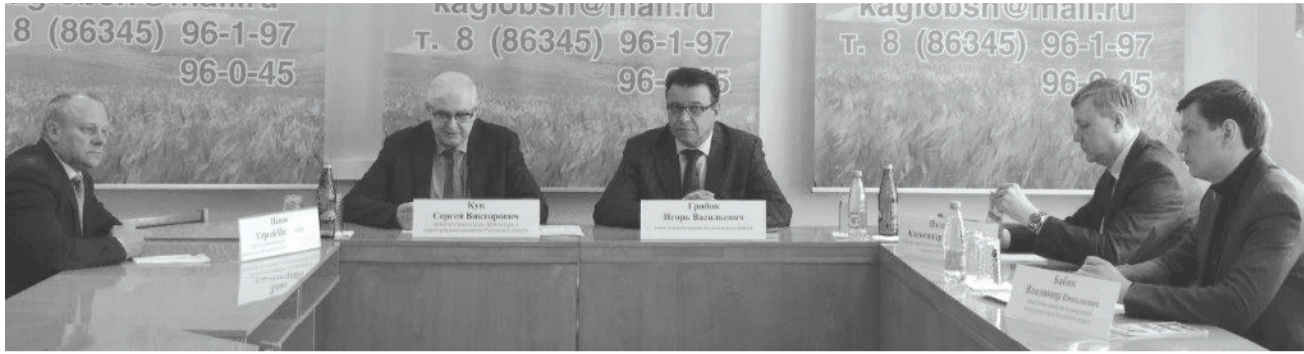
В пятницу, 19 апреля, Кагальницкий район посетила информационная группа Правительства Ростовской области.