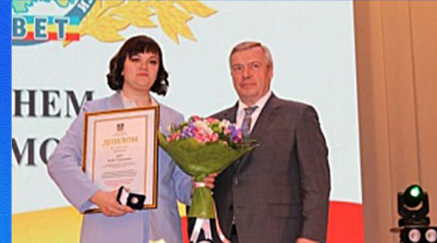
Социум: лучший муниципальный служащий