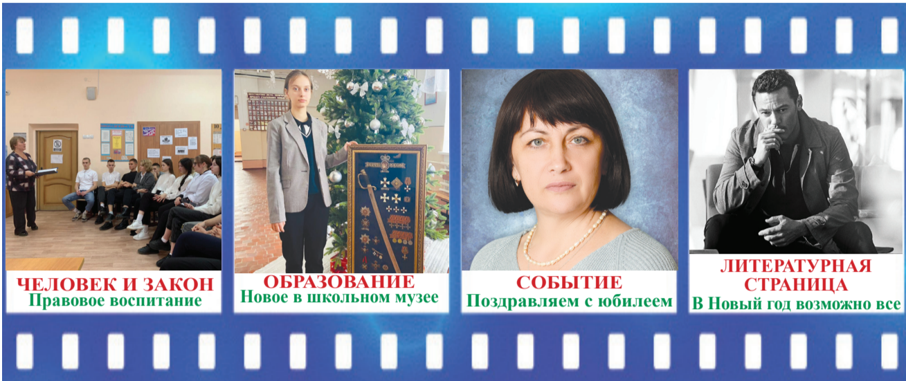
ЧЕЛОВЕК И ЗАКОН Правовое воспитание