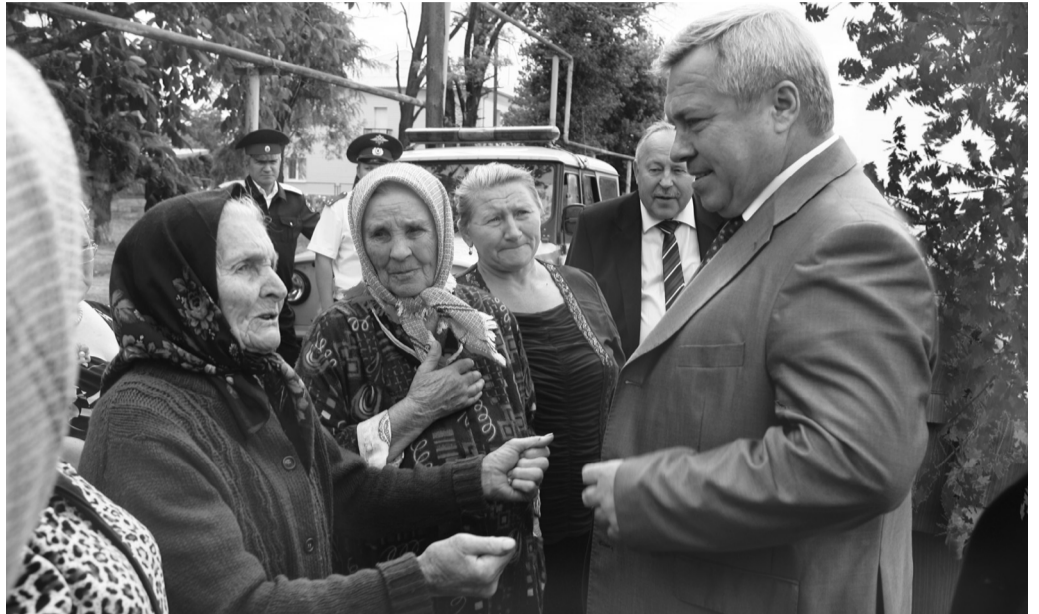
Ответом на обращения людей стали губернаторские поручения с определением четких сроков и ответственных лиц