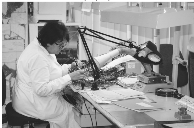
На научно-производственном предприятии космического приборостроения «Квант»

Инженерные съезды, конечно, не приводят к эпохальным изменениям, но они дают возможность предприятиям общаться, делиться опытом, проблемами, вариантами решения, мобилизуют их, стимулируют к развитию, настраивают на рабочий лад.