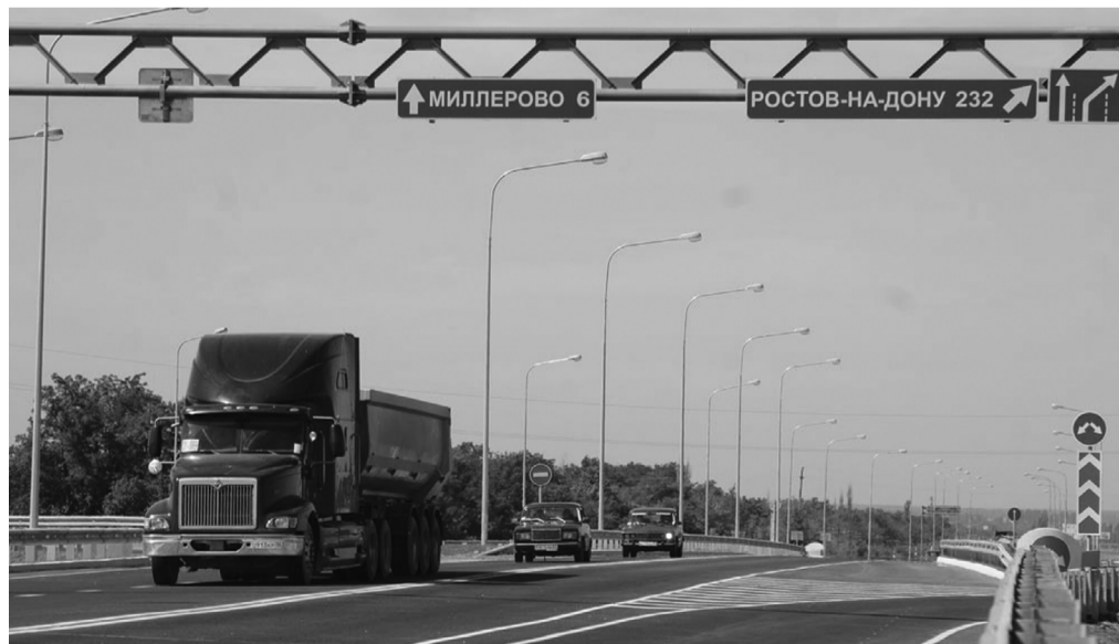
Реконструкция трассы М4 продолжается

Кроме того, большинство областных дорог построены в 60-70 годах, им нужна серьезная реконструкция.