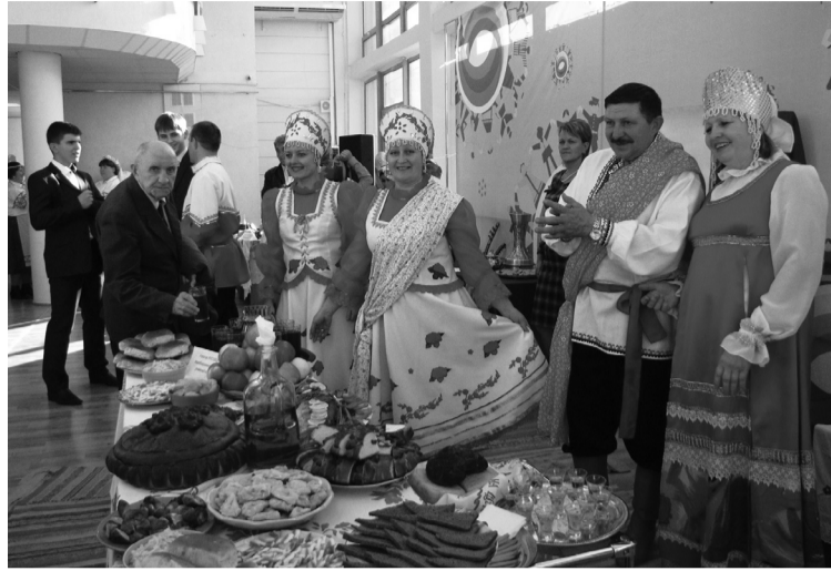
Свадебный обряд и угощение по-русски

Муниципальный ансамбль донских армян «Аны» из Мясниковского района показал, как наряжают невесту в доме ее родителей. Лицо девушки закрывают красной накидкой, которая пребывает на ней еще неделю. Сборы невесты показали и ансамбль турок-