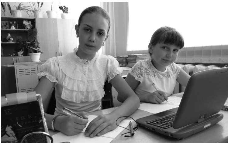
100% школ области обеспечены широкополосным доступом в Интернет

В прошлом году 60 школ получили оборудование для организации дистанционного обучения, 63 получают его