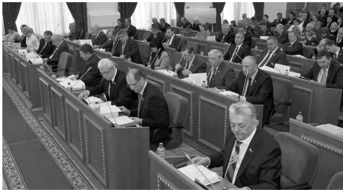
● Состоялось очередное заседание Законодательного Собрания Ростовской области

На заседании ЗС принят новый областной закон – «О развитии библиотечного дела в Ростовской области». В законе определены приоритетные на-