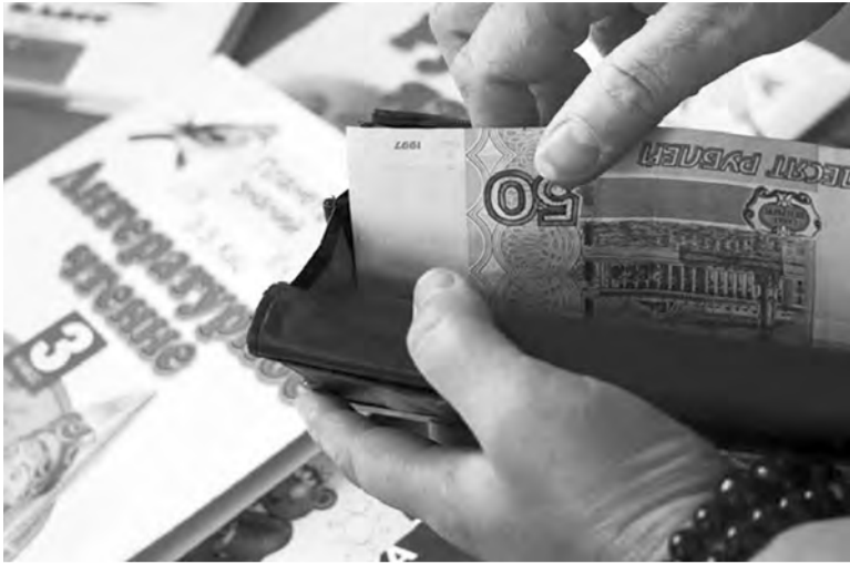
● 33 000 бюджетников поднимут зарплату уже в этом году